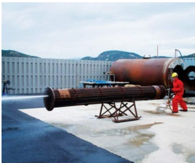
C1012 & C1013

Nous proposons trois modèles de tringleuse portative.