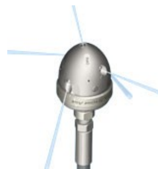
C0210 et C0211 Pour les Canalisations de 150-300mm