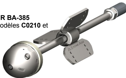
CENTREUR BA-385 Pour les modèles C0210 et C0211