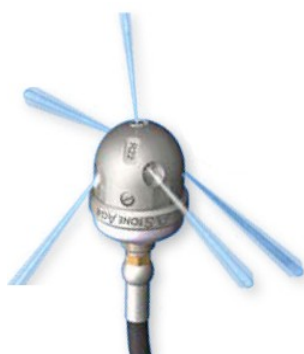
C0208 et C0209 Pour les Canalisations de 100-150mm